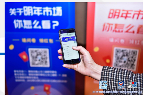
企业易拉宝宣传（自制）