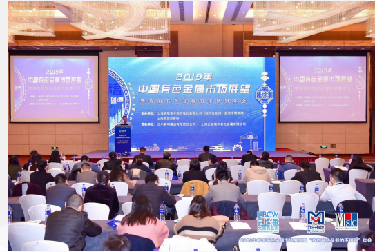
会场内主背景板列名