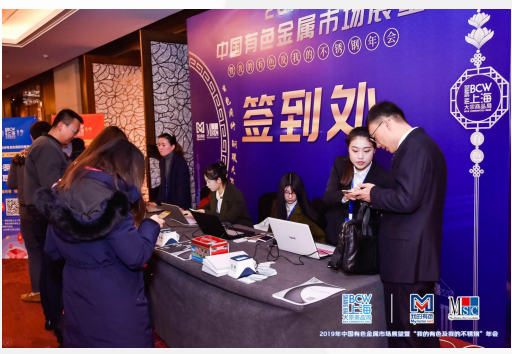
会议签到背景板列名