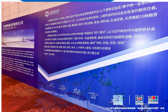
供需交流展会场内喷绘墙及展位