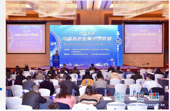
会场内主背景板列名