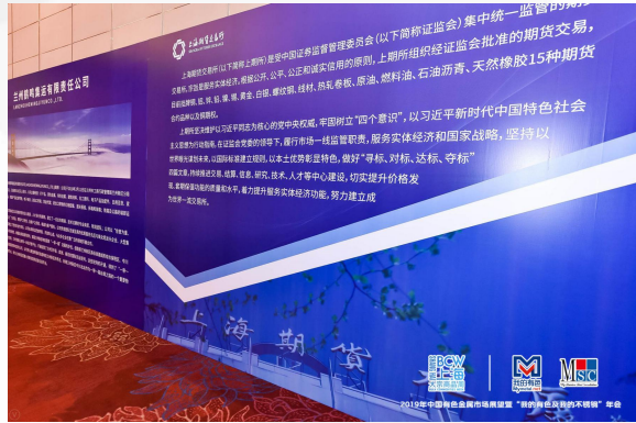
会议现场（舞台一侧）及同期 供需交流展会内大型喷绘广告、 会场外喷绘墙展示广告