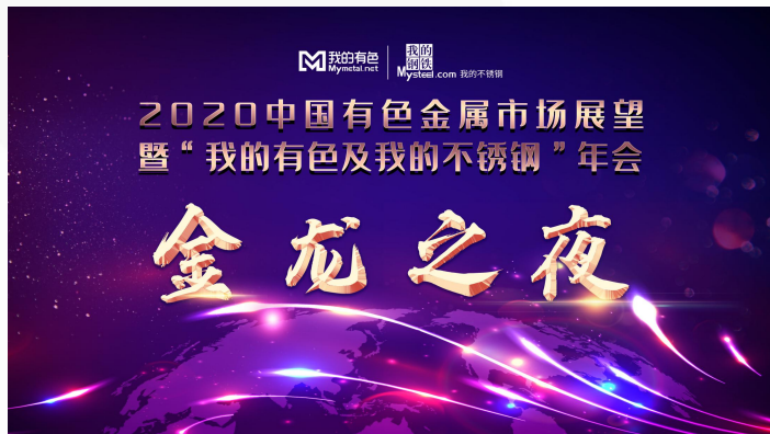
答谢晚宴独家冠、及背景展示、晚宴致辞