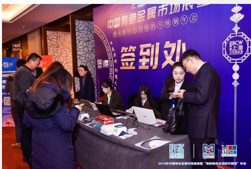
会议签到背景板列名