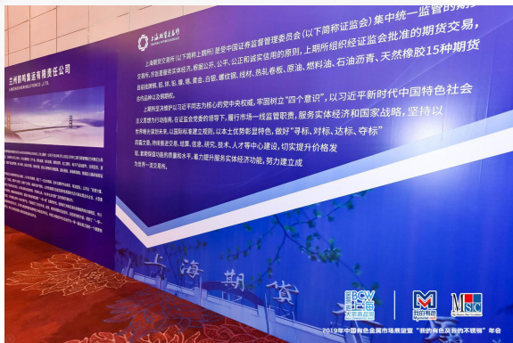
会议现场内大型喷绘广告 （舞台一侧）