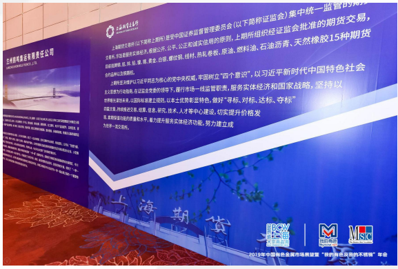
会议现场内大型喷绘 (舞台前部一侧) 和供需交流会喷绘墙广告